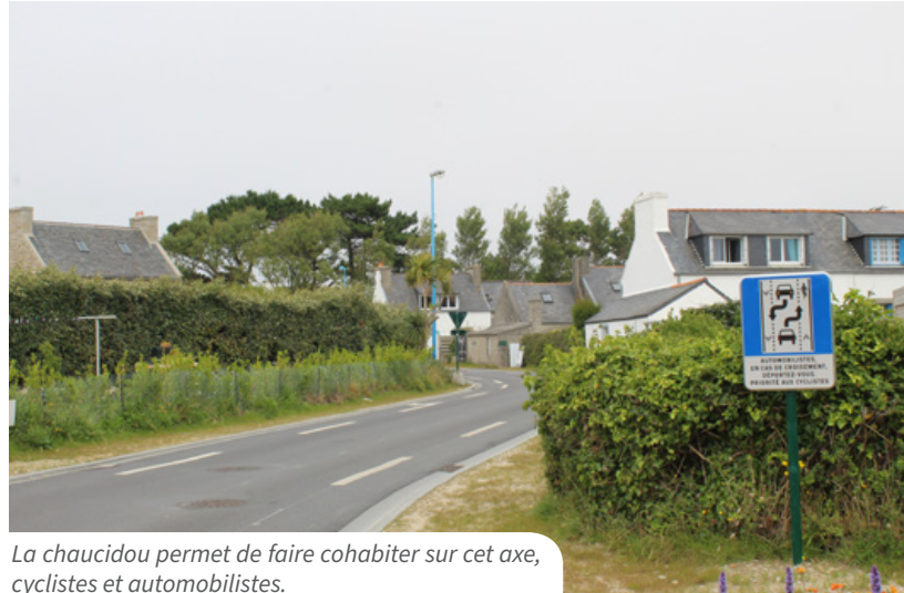
La chaucidou permet de faire cohabiter sur cet axe, cyclistes et automobilistes.

Les véhicules motorisés rouleront désormais sur une voie centrale unique, à une vitesse limitée à 30 km/h, et devront se déporter sur les bandes cyclables pour croiser un autre véhicule, tout en laissant la priorité aux cyclistes. Les piétons disposent quant à eux d'un trottoir d'1,50 m pour cheminer en toute sécurité. Ce dispositif Chaucidou, déployé sur 500 à 600 mètres linéaires, a été prolongé jusqu'au carrefour du Laber, en accord avec Santec, cette voie communale étant en limite des deux communes. La ville de Roscoff a profité de ce chantier de voirie pour inclure dans le budget (243 546 € HT) des travaux d'effacement du réseau téléphonique, de remplacement de canalisations d'assainissement et de reprises sur le réseau d'eau potable et l'éclairage public.