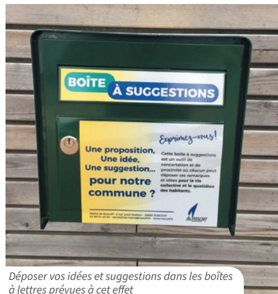
Déposer vos idées et suggestions dans les boîtes à lettres prévues à cet effet

Renseignement : Ville de Roscoff - 02 98 24 43 00