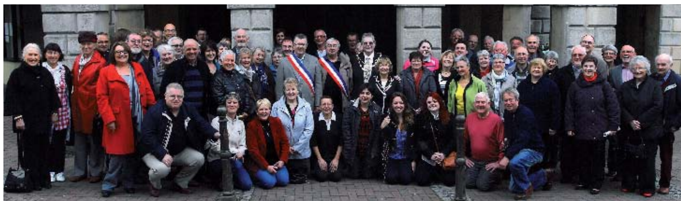
▲ Le comité a été chaleureusement accueilli à Great Torrington

Le 6 avril dernier, une trentaine de membres du comité de jumelage de Roscoff Great Torrington a embarqué sur l'Armorique après avoir reçu les souhaits de bonne traversée de M. Le Maire. Le groupe a été chaudement accueilli dans la ville jumelle. Au cours de ce week-end d'échange, Anglais et Français se sont retrouvés autour de multiples activités : concert, visites de