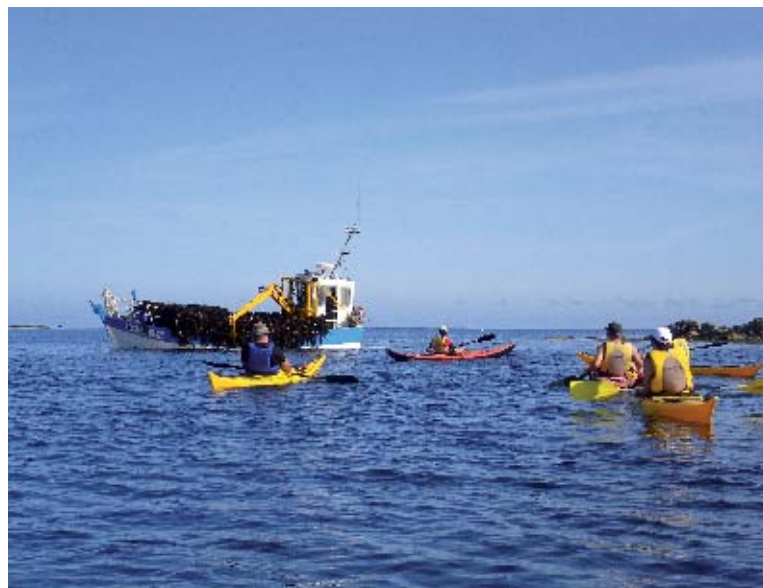
► Le Centre Nautique propose des activités pour tous !

Centre Nautique de Roscoff BP 9 - Quai Charles de Gaulle 29680 Roscoff - Tél : 02 98 69 72 79 www.roscoff-nautique.com centrenautique.roscoff@wanadoo.fr