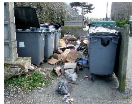
▲ Des dépôts sauvages récurrents sont signalés à Théven ar Rouanez

Considérant que la population est dorénavant informée de l'interdiction des dépôts sauvages, la Communauté de Communes sera intransigeante, engagera les poursuites nécessaires et soumettra les personnes concernées aux sanctions financières dûment prévues.