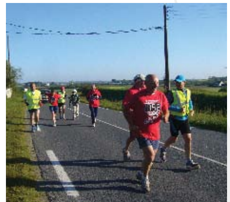
▲ Hon dilennidi o redeg gand ar vash-test d'ar sul vintin etre Mespaul ha Plouvorn evid souten ar yezh.

Groupe gauche plurielle et citoyenne http://lroscoffagauche.blogs.letelegramme.com