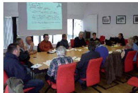
▲ Roscoff a constitué un comité de suivi zones humides