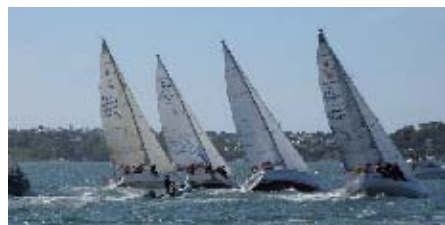
▲ Le Yacht Club a participé dernièrement à La Tresco

Renseignements : 06 75 39 68 23 http://iodeclubroscoff.free.fr ycroscoff@gmail.com