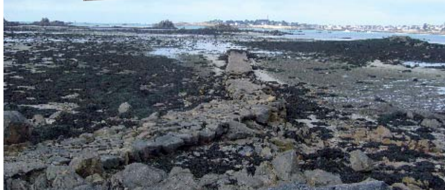
▲ La cale en face du vil permettait avant l'estacade de relier Roscoff à l'île de Batz