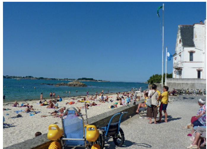
▲ La plage de Roch'Kroum dispose d'un poste de surveillance.

A l'entrée de la plage sont indiqués les informations sur les horaires et le coefficient des marées, la température de l'eau et de l'air, la