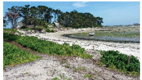
▲ Suite aux tempêtes de cet hiver, les travaux d'aménagement ont pris du retard.

initialement pour financer des travaux comme celui de Perharidy. Elle a toutefois rappelé que plus de 800 m 3 de déblais avaient été évacués avant démolition des immeubles qui menaçaient la sécurité des promeneurs, et que compte tenu des modifications apportées aux côtes en raison des événements climatiques, le projet d'aménagement sera modifié pour être mis en œuvre au premier semestre 2015. Une communication sur ce dossier sera réalisée en temps voulu.