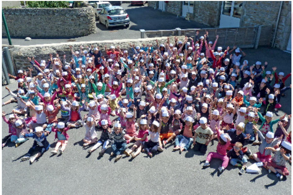
▲ Le service enfance-jeunesse de la ville de Roscoff a finalisé l'organisation des nouveaux temps périscolaires pour les deux écoles.

Les Roskorapidos : CP-CM1 CM2 (2 groupes pour Ange-Gardien / 3 Groupes pour Moguerou)