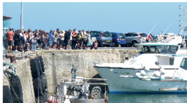
▲ Les vedettes de l'île de Batz accueillent jusqu'à 200 000 passagers par an !

Tarifs A/R : 8,50 € adultes / 4,50 € pour les 4-11 ans / 2 € pour les moins de 4 ans