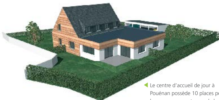
◀ Le centre d'accueil de jour à Pouénan possède 10 places pour les personnes porteuses de la maladie d'Alzheimer.

Cet investissement a été financé par le Conseil Général du Finistère, au titre du Contrat de Territoire, à hauteur de 60 000 €. L'ADS verse un loyer à la Communauté de Communes pendant une durée de 25 ans qui permet, à terme, d'équilibrer financièrement l'opération.