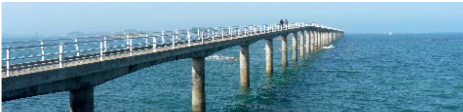
▲ La réhabilitation de l'estacade débutera en 2014

Nous comptons obtenir une subvention d'au moins 50 % du Conseil Général comme prévu au Contrat de Territoire, et espérons que du fait de ses caractéristiques (desserte de la commune de l'île de Batz), l'Etat et la Région (par le biais de l'association des Iles du Ponant) participent au financement.