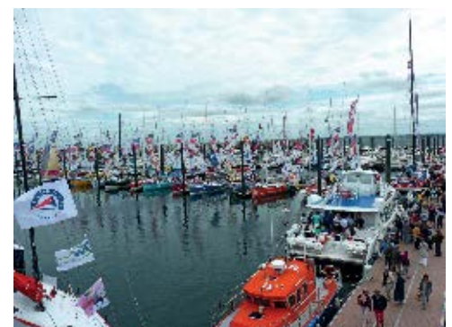
L'étape de la Solitaire du Figaro à Roscoff a amorcé la saison à Roscoff

Ce numéro de Roscoff infos est également disponible au format pdf sur le site de la ville : www.roscoff.fr .