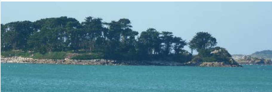
▲ L'aménagement de la pointe sera finalisée en 2014

Ces interventions ne seront effectuées qu'en début d'année 2014 pour des raisons administratives à mener (autorisations, budgets, marchés publics...) mais dès cet été une clôture sera posée sur 180 mètres, le long de la dune, afin de sécuriser le site et d'éviter l'érosion par les passages répétés des promeneurs. En effet, la mer reprenant peu à peu ses droits, la dune est actuellement en cours de restauration, créant temporairement des microfalaises qui peuvent être dangereuses pour les visiteurs.