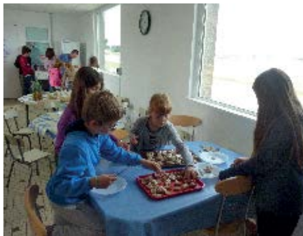
▲ Un programme riche et varié attend les enfants cet été !

Le programme estival est disponible en mairie et à l'Office du Tourisme mais également sur www.roscoff.fr