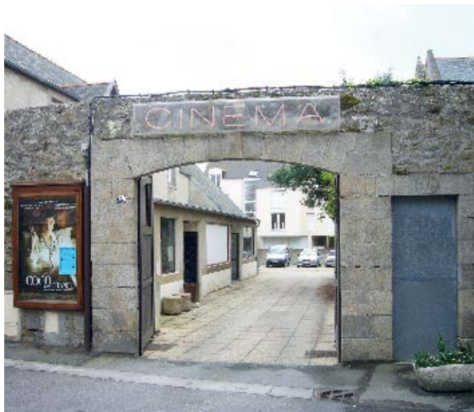
▲ Le cinéma a accueilli près de 14 000 visiteurs en 2012

Déjà équipé du numérique, le cinéma vient de s'offrir un nouvel écran (environ 3 000 €). « Lorsque vous achetez un ticket de cinéma à 6 €, la moitié de la somme est reversée au CNC (Centre