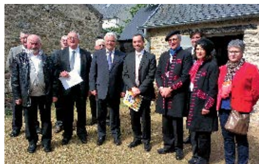
▲ Le Sous-Préfet a été accueilli à la Maison des Johnnies par les élus et les membres de la Confrérie de l'Oignon de Roscoff.

Lors de sa venue, les élus ont présenté la commune et les projets en cours. Ensuite, il a visité l'entreprise Algoplus, récoltant et transformateur d'algues alimentaires à Roscoff depuis 1993, puis s'est rendu à la Maison des Johnnies, qui retrace l'histoire des Johnnies et de l'oignon AOC de Roscoff.