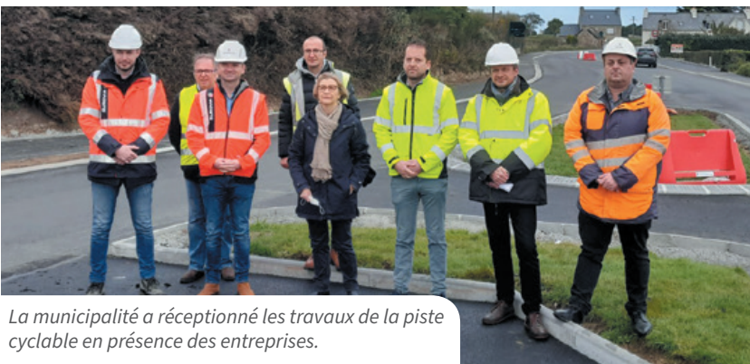
La municipalité a réceptionné les travaux de la piste cyclable en présence des entreprises.