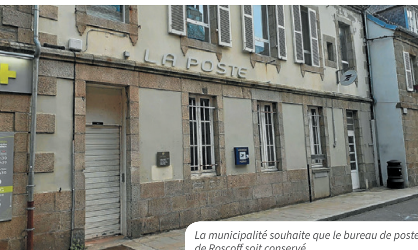
La municipalité souhaite que le bureau de poste de Roscoff soit conservé.

Selon La Poste, la fréquentation de son bureau a baissé de 64 % en huit ans. Elle envisage de délocaliser ses services. La municipalité souhaite maintenir ce point d'activité central qui doit rester de proximité.