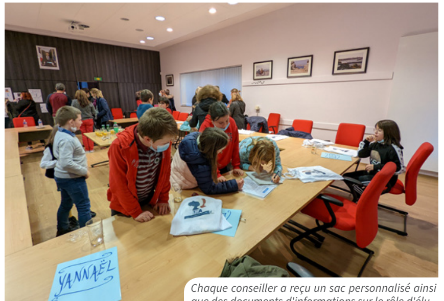
Chaque conseiller a reçu un sac personnalisé ainsi que des documents d'informations sur le rôle d'élu.

Page Facebook : @ecoleangegardienroscoff