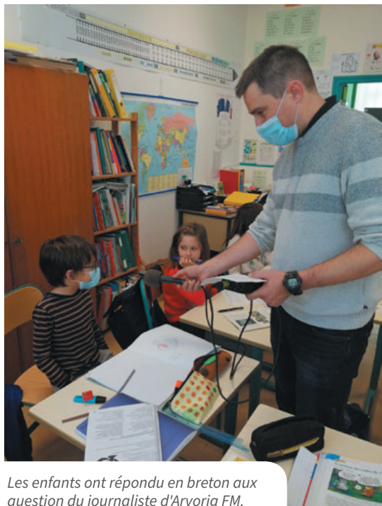
Les enfants ont répondu en breton aux questions du journaliste d'Arvor FM.