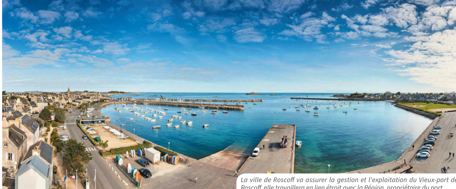
La ville de Roscoff va assurer la gestion et l'exploitation du Vieux-port de Roscoff, elle travaillera en lien étroit avec la Région, propriétaire du port