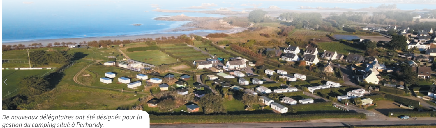
De nouveaux délégataires ont été désignés pour la gestion du camping situé à Perharidy.

Le contrat de délégation de service public de l'aire de camping-car a été attribué à Camping-Car Park, choisi parmi quatre offres, pour une durée de 20 ans également. L'aire de stationnement et de service pour les camping-cars disposera de 49 emplacements. L'ouverture est prévue au mois d'avril. Avec la création de cette nouvelle aire, l'aire du Laber ne sera plus autorisée pour l'hébergement mais seulement pour le stationnement de tous véhicules.