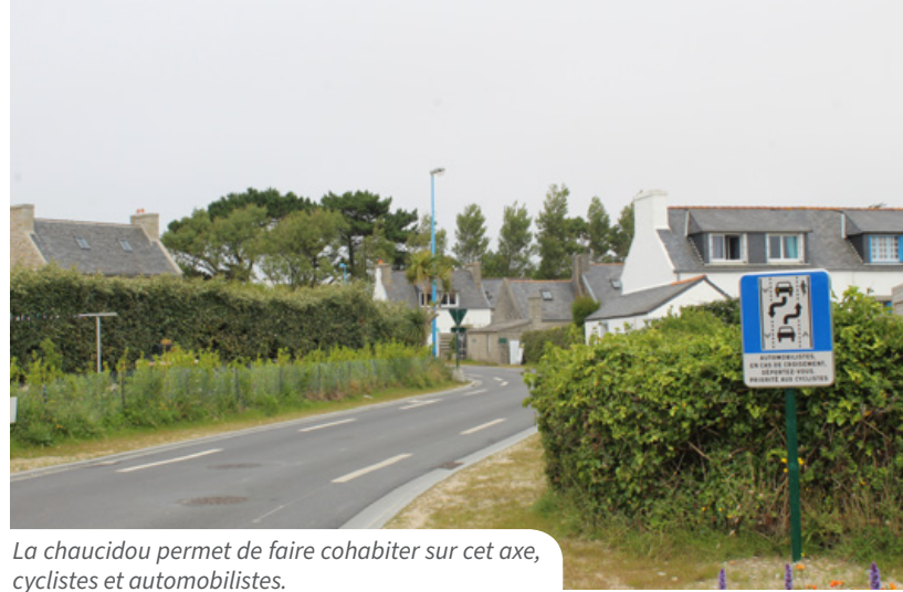
La chaucidou permet de faire cohabiter sur cet axe, cyclistes et automobilistes.

Les véhicules motorisés rouleront désormais sur une voie centrale unique, à une vitesse limitée à 30 km/h, et devront se déporter sur les bandes cyclables pour croiser un autre véhicule, tout en laissant la priorité aux cyclistes. Les piétons disposent quant à eux d'un trottoir d'1,50 m pour cheminer en toute sécurité. Ce dispositif Chaucidou, déployé sur 500 à 600 mètres linéaires, a été prolongé jusqu'au carrefour du Laber, en accord avec Santec, cette voie communale étant en limite des deux communes. La ville de Roscoff a profité de ce chantier de voirie pour inclure dans le budget (243 546 € HT) des travaux d'effacement du réseau téléphonique, de remplacement de canalisations d'assainissement et de reprises sur le réseau d'eau potable et l'éclairage public.