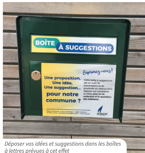
Déposer vos idées et suggestions dans les boîtes à lettres prévues à cet effet

Renseignement : Ville de Roscoff - 02 98 24 43 00