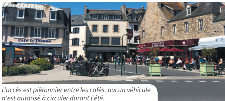
L'accès est piétonnier entre les cafés, aucun véhicule n'est autorisé à circuler durant l'été.

Afin de faciliter les déplacements de tous cet été et rendre plus agréable la déambulation des piétons, la municipalité a mis en place de nouvelles actions pour fluidifier la circulation et le stationnement, mais aussi sécuriser les secteurs piétonniers.