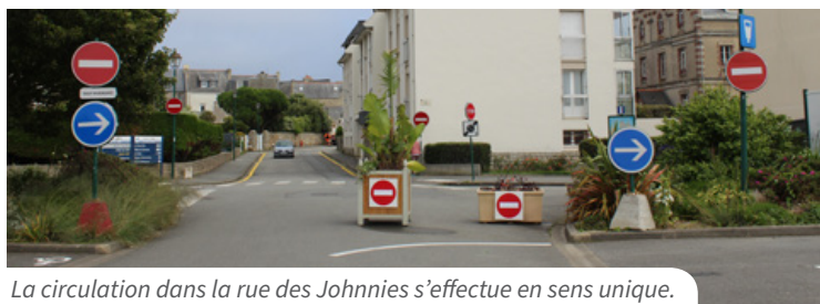
La circulation dans la rue des Johnnies s'effectue en sens unique.

Au niveau du parking Célestin Seité, un nouvel aménagement vient d'être réalisé. Pour faciliter la circulation et le retour des véhicules vers la rue Albert de Mun, une nouvelle entrée a été créée.