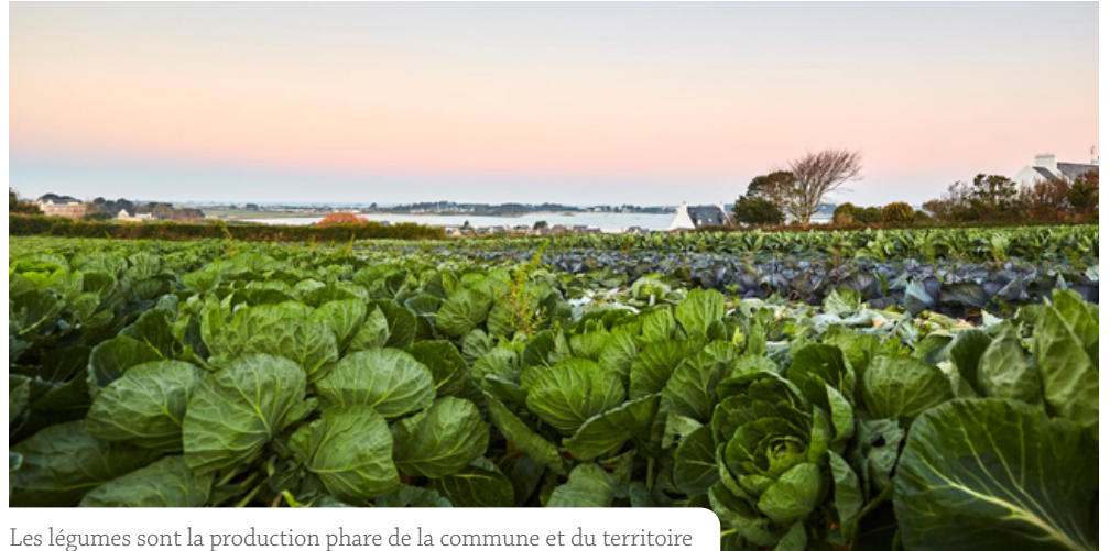
Les légumes sont la production phare de la commune et du territoire

La surface exploitée varie de 1 à 69 hectares selon les exploitations et productions en place, avec une moyenne de 17,5 hectares. Six exploitations, soit 20 % des exploitations de la commune, engagées en agriculture biologique, cultivent 74 ha, soit 14 % des surfaces agricoles. Ce chiffre est de 15,7 % à l'échelle de Haut-Léon Communauté, contre 7 % pour la Bretagne. Les productions légumières jouent un rôle clé dans cette particularité territoriale car elles représentent 74 % des surfaces Bio de Haut-Léon Communauté. À noter également, 8 exploitations réalisent de la vente directe, un flyer présente le Drive à la ferme.