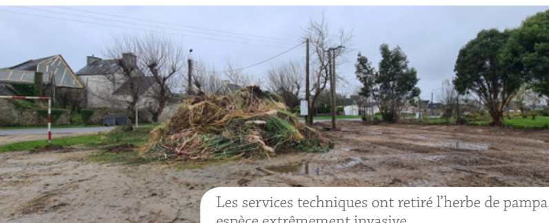
Les services techniques ont retiré l'herbe de pampa, espèce extrêmement invasive

En 2017, les difficultés pour se mettre en conformité avec les exigences sanitaires imposées, et l'âge avancé du fondateur, aujourd'hui décédé, ont conduit l'association à détruire les installations après le départ des derniers animaux.