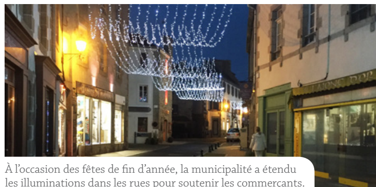
À l'occasion des fêtes de fin d'année, la municipalité a étendu les illuminations dans les rues pour soutenir les commerçants.

La page Facebook "Commerces Restaus Services" de l'office de tourisme de Roscoff apporte également des informations et un soutien au commerce local.