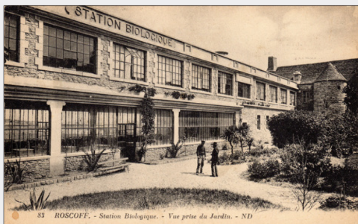
Station biologique. Vue prise du jardin. Carte postale ND, 1909.