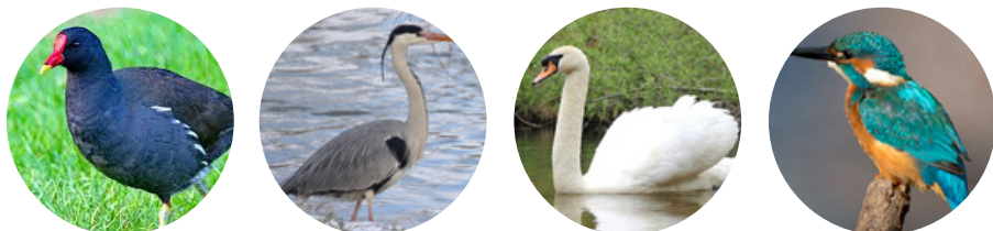
La poule d'eau, le héron cendré, le cygne tuberculé ou encore le martin pêcheur nichent à l'année au jardin

Le site du jardin est un lieu de repos et de nourrissage pour beaucoup d'oiseaux toute l'année sur les haltes migratoires. Il est entouré de zones naturelles très riches : prairie humide, vasières, roselières, haies. De ce fait, il est important de préserver ce site pour sa biodiversité et la transmission de valeurs environnementales.