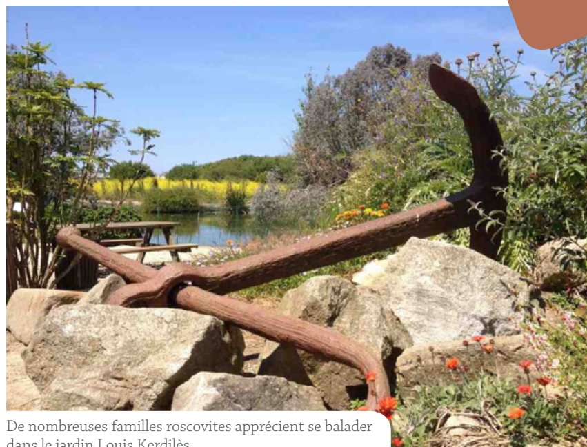
De nombreuses familles roscovites apprécient se balader dans le jardin Louis Kerdilès