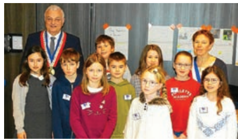
Le nouveau Conseil Municipal Enfants est entré en fonction le 26 janvier dernier, en présence de M. le Maire et de Mme Boulch.

Les élections du Conseil Municipal Enfants de Roscoff se sont déroulées le jeudi 16 janvier dernier. Les élèves de l'école Ange Gardien et des Moguérou ont ainsi pu exercer leur devoir démocratique et élire les douze membres du Conseil Municipal Enfants.