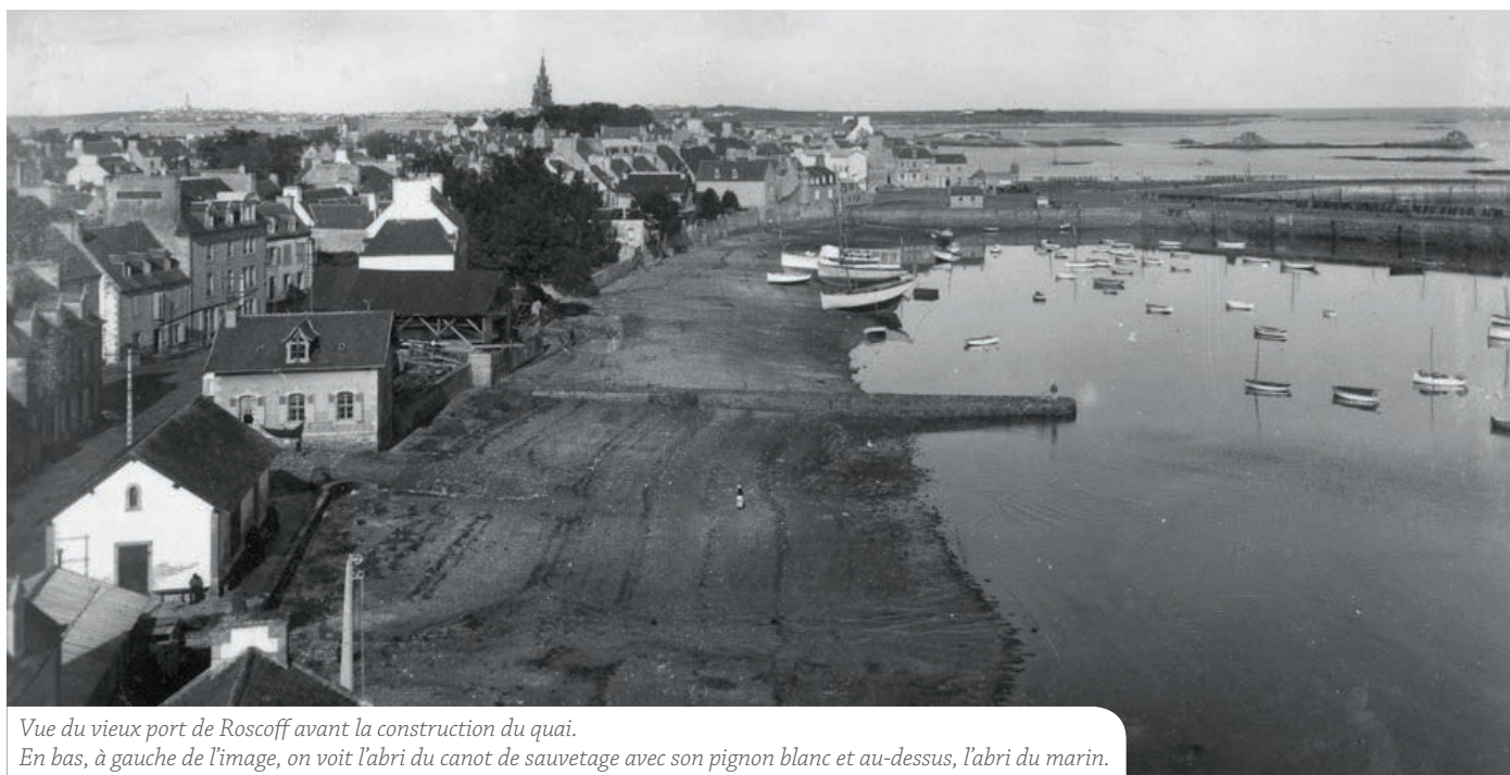
Vue du vieux port de Roscoff avant la construction du quai.

Ces abris du marin ont peu à peu fermé au fil de l'amélioration des conditions de vie des marins. Celui de Roscoff est aujourd'hui un commerce mais son architecture et sa façade font de cette bâtisse un élément remarquable sur le vieux port de Roscoff, témoin d'une histoire pas si lointaine.