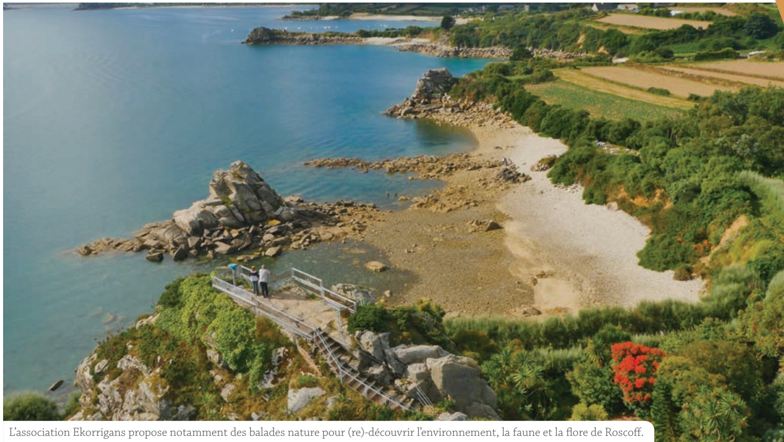
L'association Ekorrigans propose notamment des balades nature pour (re)-découvrir l'environnement, la faune et la flore de Roscoff.

Créer du lien social, transmettre les savoirs-faire et les connaissances en matière d'écologie et de respect de l'environnement sont les maîtres-mots de cette nouvelle association.