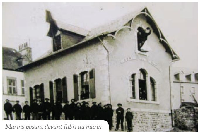
Marins posant devant l'abri du marin

En 1919, le journal Ouest-Eclair précise que 15 219 marins ont été accueillis à Roscoff durant l'année.