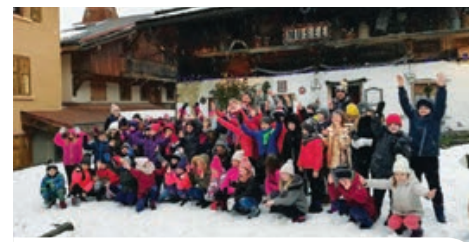
Du ski mais aussi des visites historiques et culturelles que les petits roscovites ont su apprécier !

Ce séjour est facilité grâce au jumelage Roscoff/