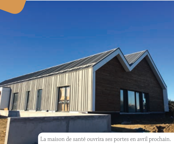
La maison de santé ouvrira ses portes en avril prochain.

La Maison de Santé de Roscoff est en cours d'achèvement. Après le gros œuvre et la couverture, il ne reste que quelques travaux de finition et l'aménagement paysager à réaliser. Les professionnels de santé y accueilleront leurs patients dès début avril.