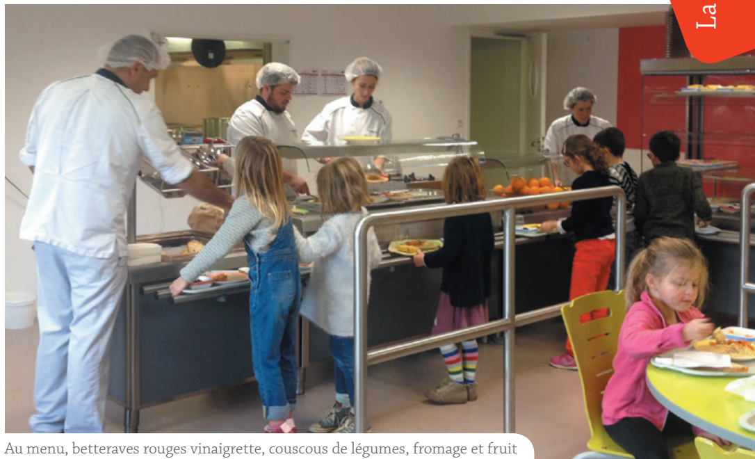
Au menu, betteraves rouges vinaigrette, couscous de légumes, fromage et fruit