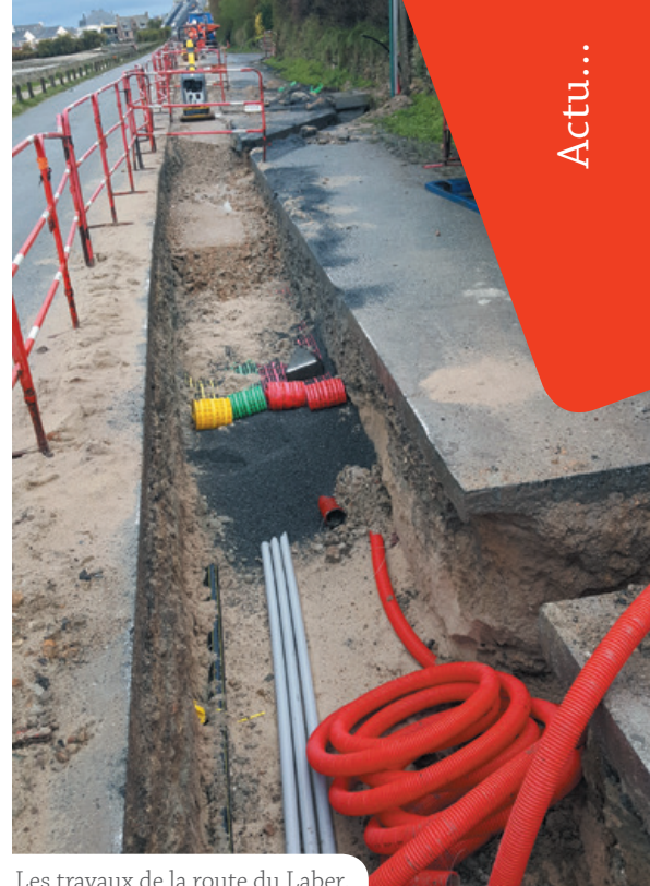
Les travaux de la route du Laber.

Ces travaux présentent le double avantage d'améliorer le paysage environnemental en supprimant les câbles électriques aériens tout en sécurisant ces réseaux, notamment lors des forts coups de vent et tempêtes.