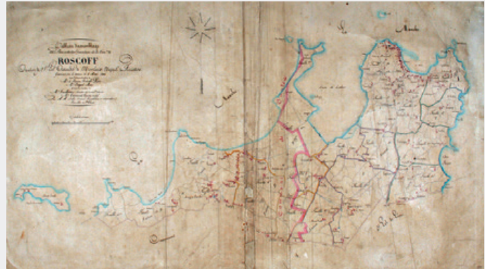
Extrait du cadastre de Roscoff de 1846. La séparation entre Santec et Roscoff (trait rose) a été rajoutée à une date postérieure.

Une autre tentative santécoise vit le jour en 1835 mais sans succès.