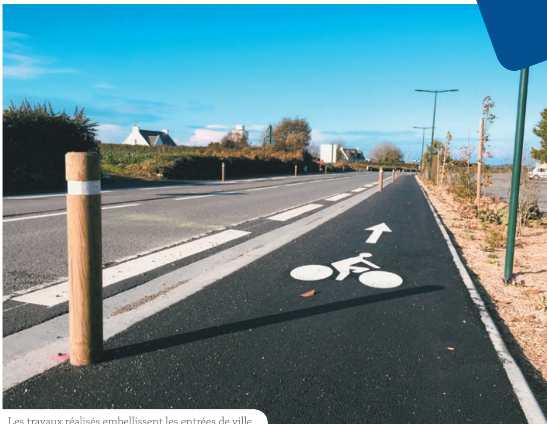
Les travaux réalisés embellissent les entrées de ville

Les travaux d'aménagement des pistes cyclables au niveau des deux entrées de ville de Roscoff se sont achevés fin novembre pour un résultat plus que satisfaisant : au-delà de l'esthétisme, c'est la sécurité des usagers (piétons, cyclistes et automobilistes) qui est dorénavant assurée. Le planning des travaux (durée 3 mois) a été parfaitement respecté grâce à la maîtrise d'œuvre menée par ING Concept et l'entreprise de travaux publics Colas. Sur les cinq tranches à réaliser, deux sont désormais opérationnelles avec 1710 mètres de linéaire cyclable réalisés. La municipalité va poursuivre le travail en 2019. L'aménagement de ces deux tronçons s'élève à 508 620 € TTC, la ville a pu bénéficier de subventions de la part du Conseil Départemental mais également de l'Etat au titre de la transition énergétique (TEPCV) pour un montant total de 357 500 € HT, soit un reste à charge pour la commune de 160 860 € TTC.