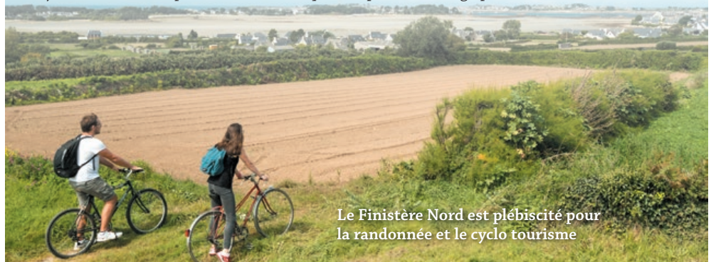
Le Finistère Nord est plébiscité pour la randonnée et le cyclo tourisme

La mise en place d'un nouveau circuit vélo-marche est envisagée pour 2019 dans l'ensemble du territoire. L'étude menée en 2018 par une étudiante en master devrait aboutir à une publication, après validation par le Département, des sept circuits inscrits proposés. Pour Roscoff, un circuit est prévu de la vieille ville à la presqu'île de Perharidy, à vélo. Ensuite, le sportif pourra arpenter la plage à pied, après avoir garé son vélo en un lieu signalé. La signalétique globale devrait être prise en charge par Haut-Léon communauté.