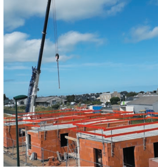
La construction des logements sur la partie sud de l'éco-quartier avance dans les délais impartis

La municipalité a rencontré en décembre Finistère Habitat afin d'évoquer l'implantation future de logements derrière la maison de santé pluridisciplinaire qui sera sortie de terre en 2019. Une quinzaine de logements en location ainsi que des maisons individuelles pour primo-accédants verront le jour à l'horizon 2020/2021.