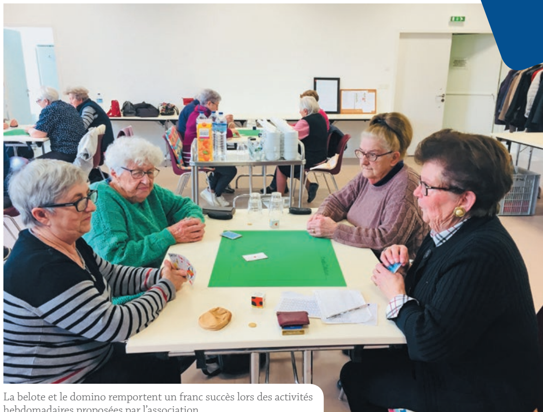
La belote et le domino remportent un franc succès lors des activités hebdomadaires proposées par l'association