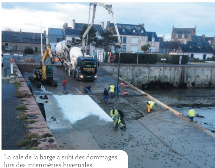
La cale de la barge a subi des dommages lors des intempéries hivernales

près de 30 ans, a entrepris ces effacements, qui valorisent le paysage environnemental (plus de câbles électriques en hauteur) et qui évitent également les ennuis par fortes tempêtes.