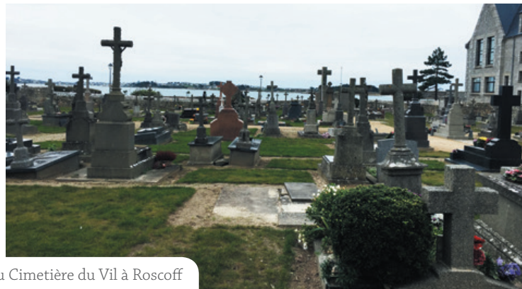
La ville se charge de l'entretien et de la gestion du Cimetière de Kermenguy et du Cimetière du Vil à Roscoff