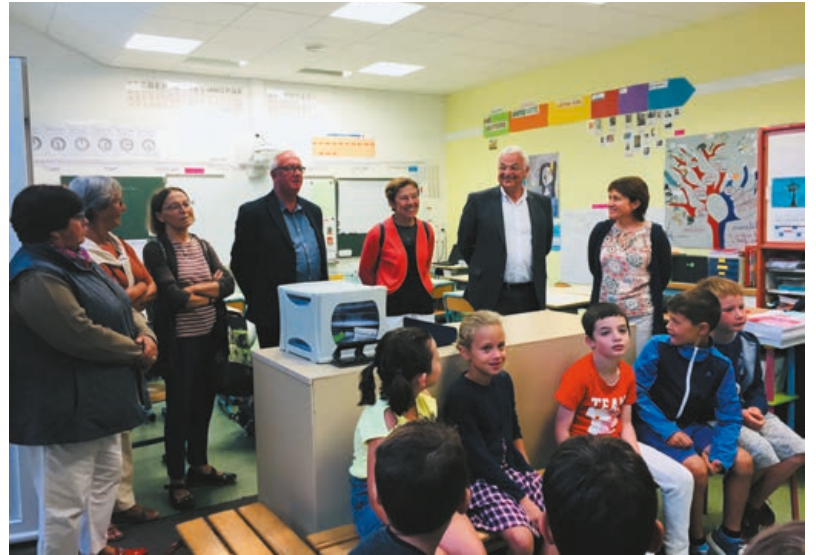
Le 3 septembre dernier, les élus sont allés à la rencontre des élèves dans les deux écoles de la commune