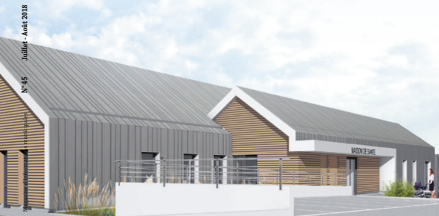
La maison de santé sera implantée à Kergus

Si vous connaissez une personne susceptible d'être intéressée, veuillez prendre contact avec la Mairie de Roscoff au 02 98 24 43 00 ou par mail : secretariat.mairie@roscoff.fr