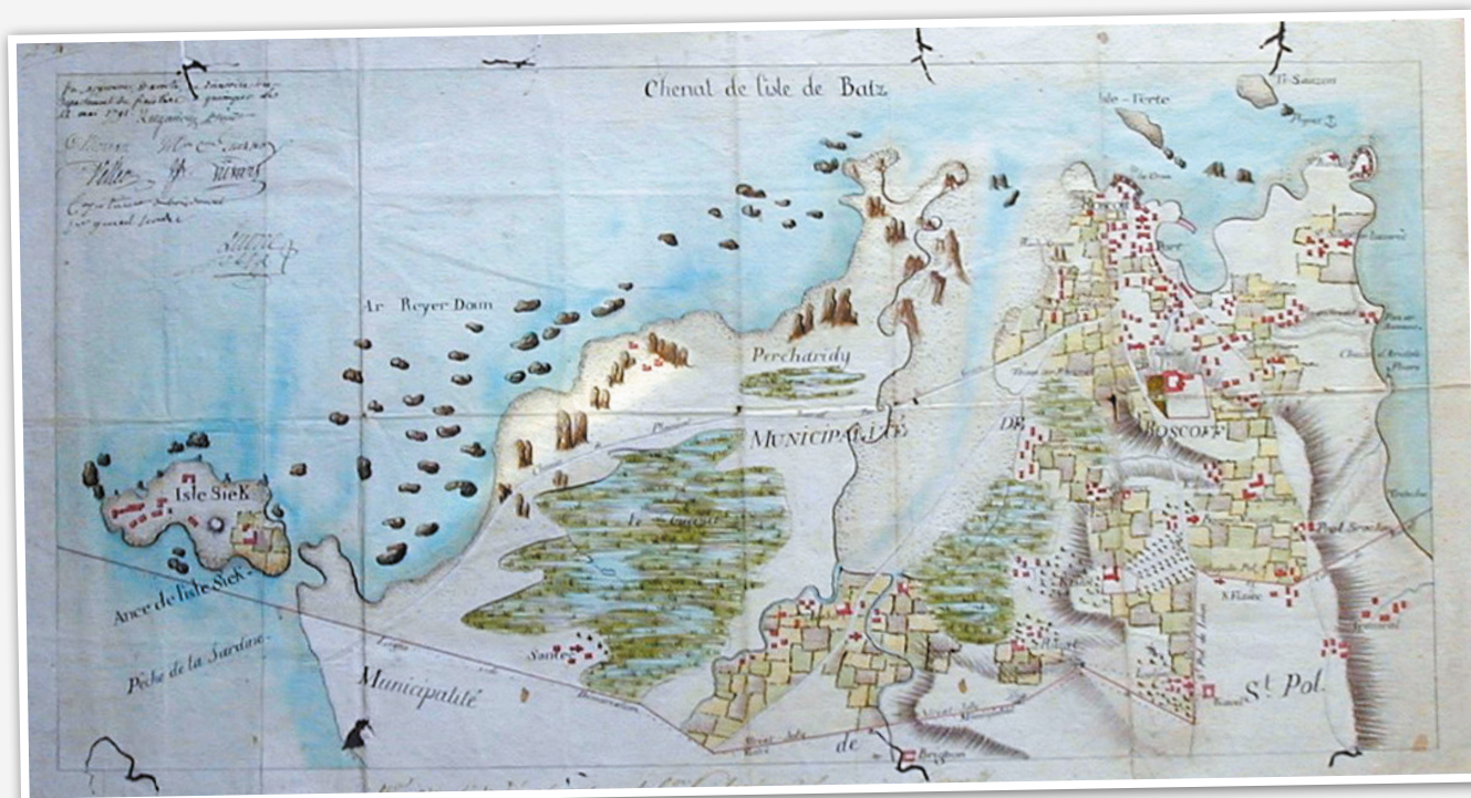
Carte de Roscoff dressée en 1791 pour établir la délimitation entre Roscoff et Santec.