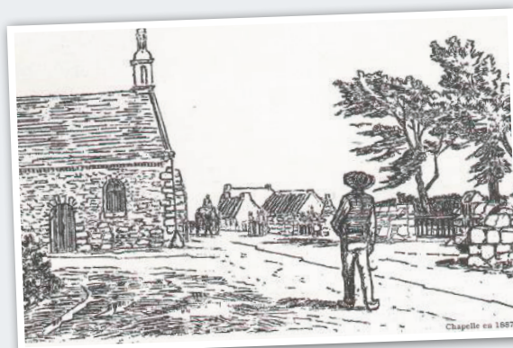
Chapelle en 1887

Les Capucins s'installèrent à Roscoff, dès 1621, à la demande de la population. Leur église avec ses deux chapelles latérales fut le lieu d'inhumation des Pères défunts et de quelques « personnes de qualité ». Pendant plus de 150 ans, les Capucins vouèrent leurs services aux habitants, enseignant par exemple la culture des primeurs et de l'oignon. Ils plantèrent un figuier qui atteignait plus de 600 m en 1986, date à laquelle il fut rasé. Le couvent connut des heures difficiles pendant la Révolution et fut vendu comme « bien national » en 1796. Il changea plusieurs fois de propriétaire jusqu'au retour des Capucins de 1936 à 1985.