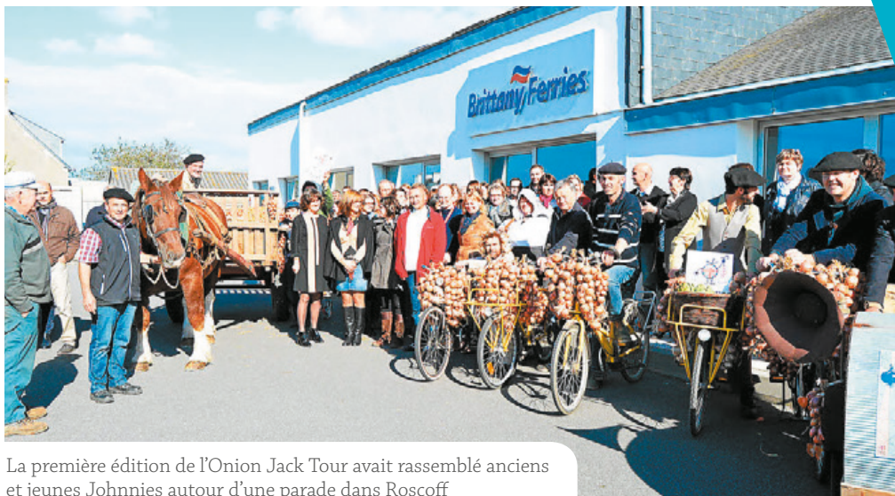
La première édition de l'Onion Jack Tour avait rassemblé anciens et jeunes Johnnies autour d'une parade dans Roscoff

Rens. : theonionjack@gmail.com - Fb : Festivak Onion jack Tour #2