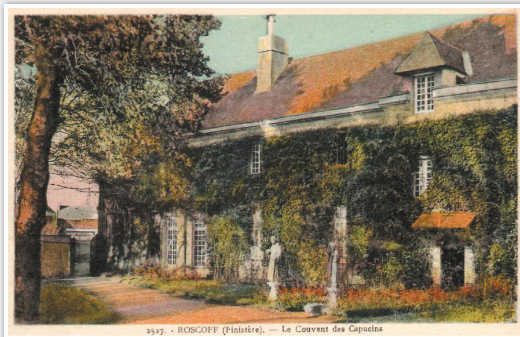
2527. - ROSCOFF (Finistère). — Le Couvent des Capucins

En 1574, l'évêque de Léon fit don d'un champ situé à Goas-Prat pour y établir un hôpital destiné à recevoir « les orphelins et les pauvres sans assistance et sans pain ». Sa construction débuta fin 1575. On y établit un cimetière de l'autre côté de la route qui menait à Saint-Paul.