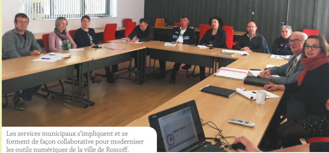
Les services municipaux s'impliquent et se forment de façon collaborative pour moderniser les outils numériques de la ville de Roscoff.

Trois fois par semaine, les lundis, mardis et jeudis, de 16h45 à 17h30, dans les deux écoles de la commune, le service enfance jeunesse de la ville (dans le cadre de l'accueil périscolaire) propose aux enfants, avec l'aide de bénévoles, un temps d'aide aux devoirs. Afin de renforcer l'équipe, un appel est lancé aux personnes qui auraient un peu de temps libre à consacrer aux enfants.