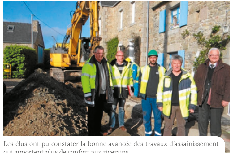
Les élus ont pu constater la bonne avancée des travaux d'assainissement qui apportent plus de confort aux riverains.

La ville a réalisé des travaux d'extension du réseau d'assainissement et du renforcement du réseau d'eau potable, rue de la Grande Grève et à Pemprat. Commencés fin février, ils se sont terminés fin avril. Ont été traités 600 m. de réseau gravitaire pour les eaux usées, 35 m. de forage profond sous la voie SNCF, 400 m. de longueur de réseau de refoulement pour les eaux usées et 500 m. de longueur de réseau renouvelés pour l'adduction d'eau potable. Ces travaux, inscrits dans une programmation pluriannuelle, ont pour objectif d'améliorer la vie quotidienne des riverains, mais aussi de réduire la pollution des plages. Les travaux des réseaux (284 000 €) ont été effectués par la société Lagadec, de Pleyber-Christ, et ceux pour le poste de refoulement (56 000 €) par la société Premel Cabic, de Plounévez-Lochrist. Les prochains chantiers auront lieu à Kermenguy et Kerfissiec. La compétence pour l'eau et l'assainissement devrait être du ressort de Haut-Léon Communauté à partir de 2020.