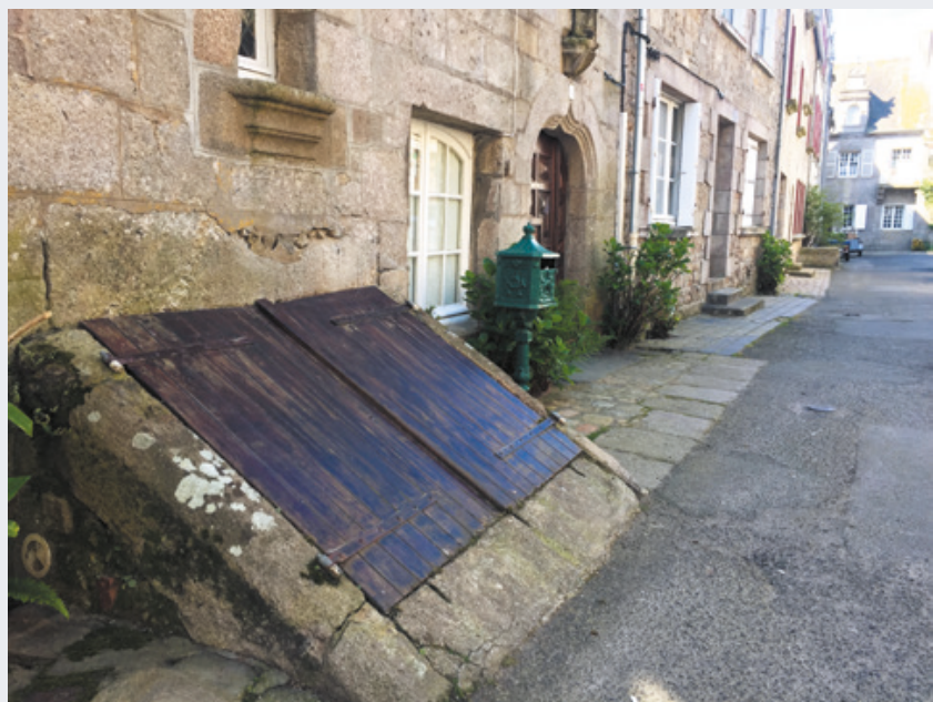
Une cave située rue Armand Rousseau

A Roscoff, une des particularités du patrimoine bâti tient en la conservation d'un certain nombre d'entrées de cave « à fleur de rue » débordant sur la chaussée, rappelant une sorte d'écoutille. Une dizaine de marches permettent de descendre directement à la cave, fermée par une porte basse.