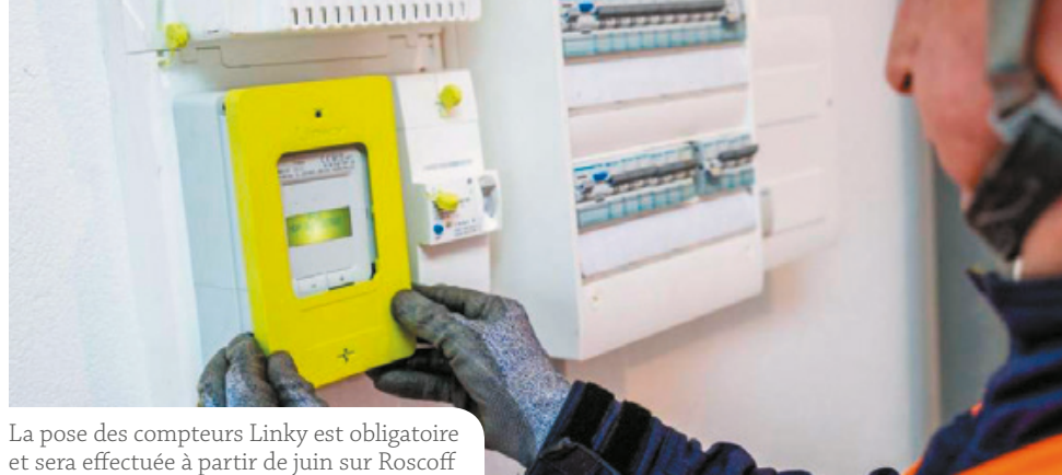
La pose des compteurs Linky est obligatoire et sera effectuée à partir de juin sur Roscoff