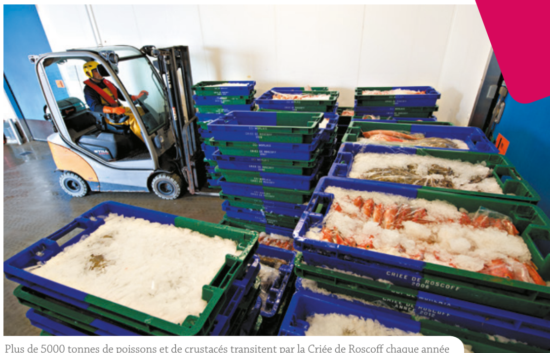
Plus de 5000 tonnes de poissons et de crustacés transitent par la Criée de Roscoff chaque année

La ville de Roscoff s'est dotée d'une criée en 1988, sous gestion d'une société d'économie mixte. En 1991, un consensus local a conduit la CCI de Morlaix à reprendre la gestion de la criée. L'équipement, ne répondant pas aux normes européennes, était placé en centre-ville, dans un port à marée et sur un site ne permettant pas d'extension. Il est très vite apparu nécessaire de le déménager au port du Blosson. Les premiers coups de pioche ont été donnés en 1999, pour une mise en service en février 2003.