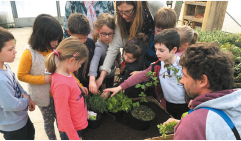
◀ Atelier plantations pour les maternelles des Moguerou

les élèves ont passé une matinée à réaliser des semis puis les plantations dans trois grands bacs qui ont maintenant trouvé leur place à l'école ainsi que l'hôtel à insectes réalisé courant mars par la classe de CE1-CE2.