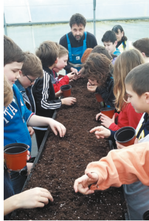
Réalisation de semis pour l'école Ange-Gardien ▶

Le restaurant scolaire a effectué de nombreuses actions pour sensibiliser les enfants au "mieux consommer" (circuits courts et bios, tri alimentaire, sensibilisation au gaspillage). Cette année, c'est le service espaces verts qui prend le relai avec la création de jardins pédagogiques dans les deux écoles de Roscoff.