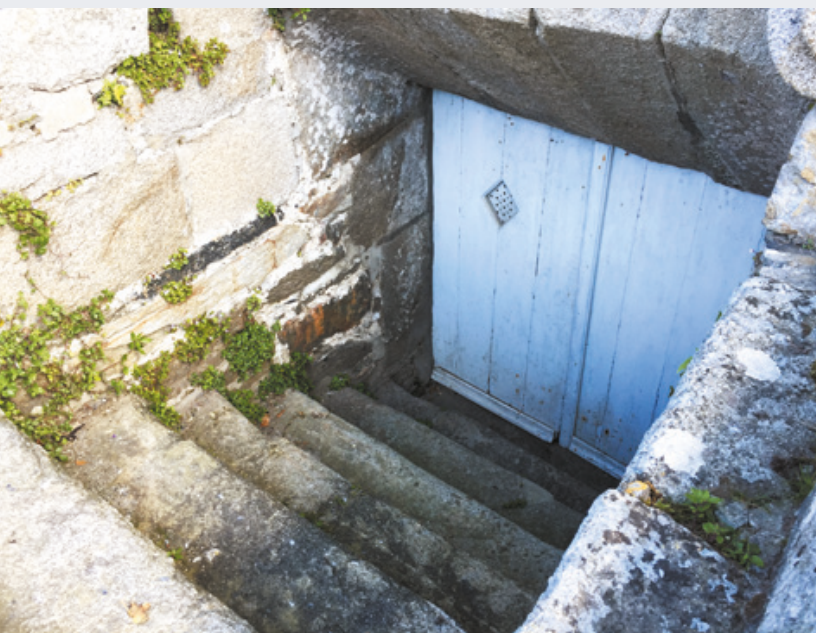
Une entrée de cave Place Lacaze Duthiers

Cave vient du latin cavus, creux : local souterrain aménagé, servant d'entrepôt.