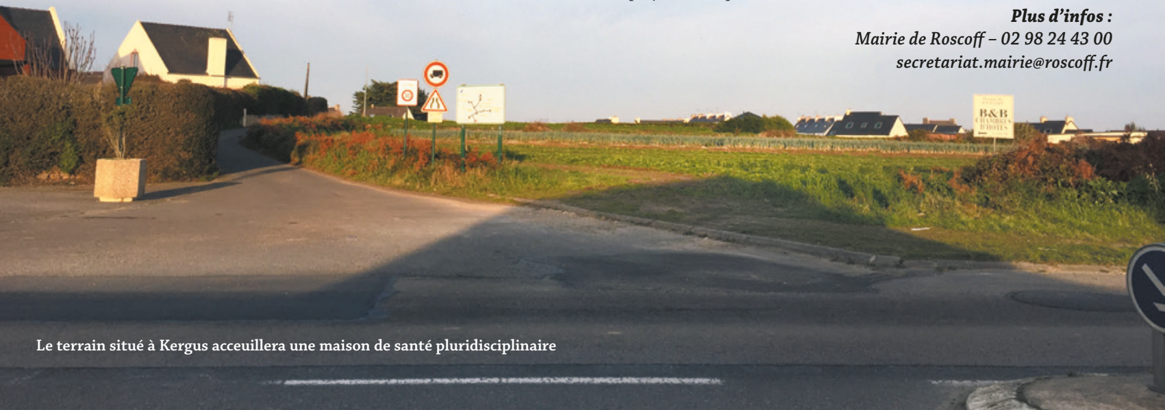
Le terrain situé à Kergus accueillera une maison de santé pluridisciplinaire