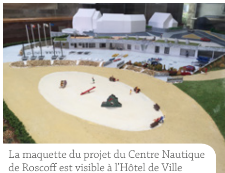
La maquette du projet du Centre Nautique de Roscoff est visible à l'Hôtel de Ville