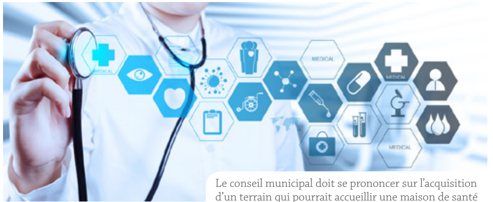
Le conseil municipal doit se prononcer sur l'acquisition d'un terrain qui pourrait accueillir une maison de santé

Une issue favorable semble être sur le point d'être trouvée, puisque le conseil municipal se prononcera le 23 septembre sur l'opportunité d'acquérir un terrain appartenant à l'EHPAD Saint Nicolas et examiner les modalités de construction d'un bâtiment destiné à accueillir médecins, infirmiers, podologue, ostéopathe,... et de nouveaux spécialistes intéressés par une implantation dans notre ville. Plusieurs hypothèses de réalisation du projet sont explorées et l'option définitive sera arrêtée en accord avec les parties prenantes.