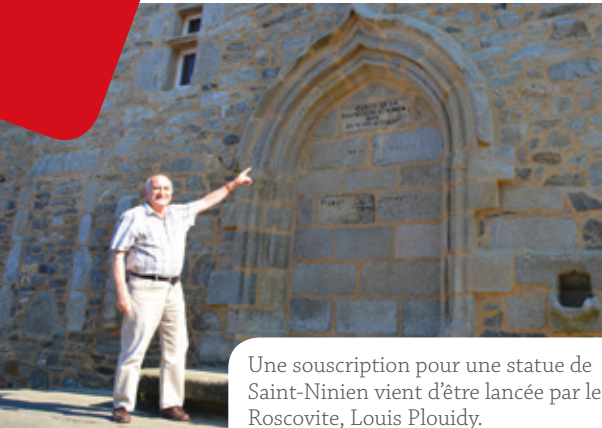
Une souscription pour une statue de Saint-Ninien vient d'être lancée par le Roscovite, Louis Plouidy.

La vallée des Saints est ce projet fou qui a vu le jour à St-Pol-de-Léon en 2008 et qui consiste à sculpter 1000 statues géantes en granit représentant les saints bretons