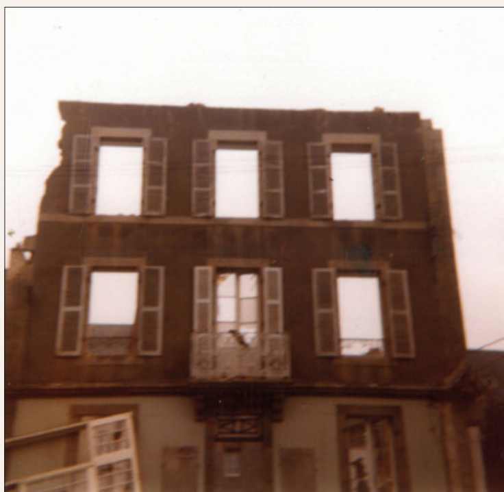
Démolition de l'ancienne maison Jacq.

Les locaux de la rue Louis Pasteur étant devenus inadaptés à leur fonction et la maison trop petite, en 1977 le maire, Adrien Stéphan, projette la construction d'une nouvelle mairie place de la République, à l'emplacement des chantiers Le Got. Débute alors une période d'agitation particulièrement vive et le projet de nouvelle mairie devient un enjeu électoral. A l'occasion des élections, la municipalité Stéphan se voit supplantée par la liste de Jean-Marie Paugam. Ce dernier opte pour un bâtiment résolument moderne pour l'époque, signé des jeunes architectes du cabinet Heuzé-Corre-Honoré-Denis, qui s'élèverait en lieu et place de la maison Jacq et annexerait le vieux presbytère. Les débats sont houleux, au point que la presse nationale s'en fait même l'écho. Malgré une vive contestation, la maison Jacq est abattue et le bâtiment que nous connaissons actuellement érigé pour un coût total de 2,3 millions de francs (honoraires des architectes, travaux hors marchés et prestations de sécurité compris).