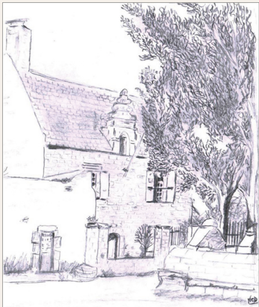
La Mairie en 1857 (dessin réalisé par N. Calvez-Duigou à partir d'un cliché, archives départementales du Finistère, 24 Fi 50, Voyage en Bretagne)

L'élection d'un nouveau maire, Michel Bagot, est l'occasion d'un nouveau déménagement. En effet, celui-ci décide de louer, le 25 août 1825 à son beau-fils, Pierre Nicolas Lahalle, l'une des maisons qu'il possède en face de l'église. Le choix se porte sur la maison voisine de l'actuel presbytère, au 12 de la rue Albert de Mun.