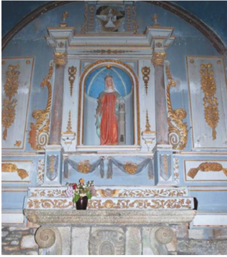
La chapelle Ste Barbe abrite un retable inscrit à l'Inventaire Supplémentaire des Monuments Historiques

La ville de Roscoff a engagé une étude pour la restitution du retable de la Chapelle Sainte-Barbe sur les préconisations de la Direction Régionale des Affaires Culturelles (DRAC). Cette étude a été réalisée entre mai 2015 et avril 2016 par les Ateliers Le Ber, en collaboration avec l'entreprise Arthema Restauration.