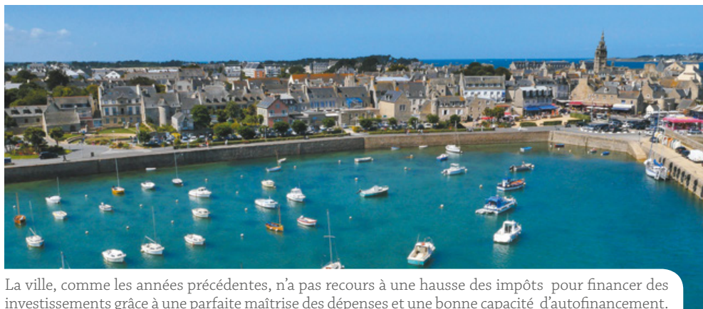
La ville, comme les années précédentes, n'a pas recours à une hausse des impôts pour financer des investissements grâce à une parfaite maîtrise des dépenses et une bonne capacité d'autofinancement.

Enfin l'endettement qui s'établit à près de 8 millions d'euros est en baisse de 2% et la capacité de désendettement est de 10 années. Ces très bons résultats permettent de bâtir un budget qui maintient le cap annoncé dès la fin 2014, et assure un niveau d'investissement correct, et des perspectives d'évolution encourageantes.