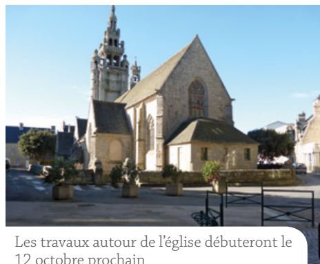
Les travaux autour de l'église débuteront le 12 octobre prochain

A partir du mois d'octobre, la commune va engager l'achèvement du chantier de réaménagement des rues commerçantes (rue Gambetta et rue Réveillère) en réalisant le tour de l'Eglise.