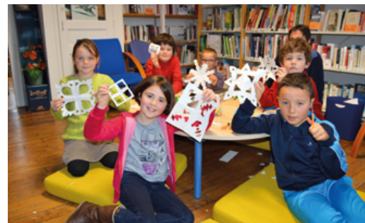
Les petits ateliers créatifs remportent un franc succès auprès des 7-12 ans.

ont aimés. Les rencontres s'effectuent une fois par trimestre, et nous éditerons en fin d'année un livret avec les conseils de lecture des roscovites. Pour l'instant, deux livres remportent tous les suffrages. Il s'agit de « Au revoir la haut » de Pierre Lemaître et « Les esprits de l'eau » de Christie Watson. »