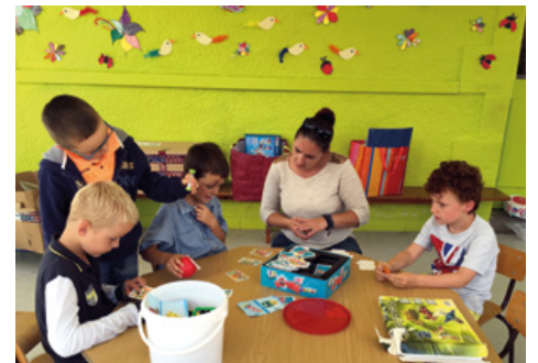
Au programme de cette première séance d'activité de l'année scolaire : jeux de société

postal, le ping-pong, la médiation du livre ou encore l'atelier petit reporter sont les nouveautés de cette rentrée. La séance de cinéma sera toujours proposée à chaque trimestre. Treize agents municipaux encadrent ces temps d'activités.