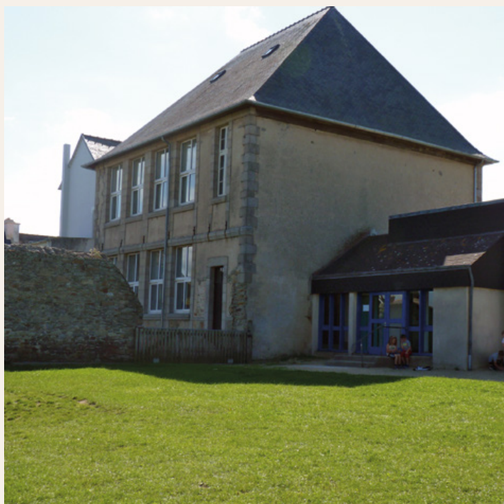
L'école des Mogérou aujourd'hui