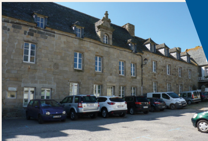
Ancienne école des garçons - Place de l'église