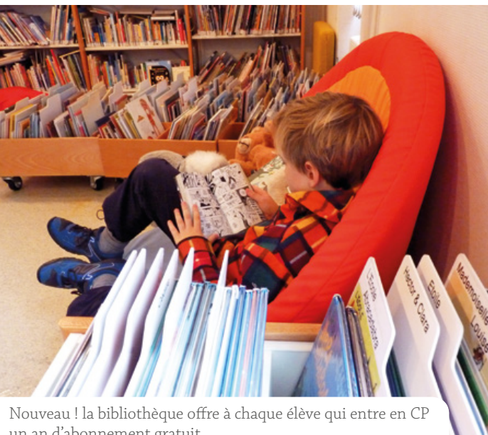
Nouveau ! la bibliothèque offre à chaque élève qui entre en CP un an d'abonnement gratuit.

La bibliothèque municipale de Roscoff propose quelques nouveautés à l'occasion de la rentrée.