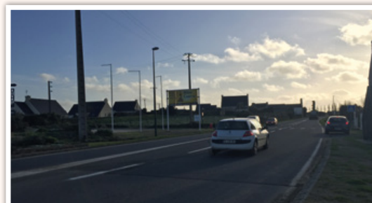
La poursuite de l'étude pour la création d'une piste cyclable entre Saint Pol de Léon et le supermarché Casino à l'ouest, et le port de Blosson, à l'est.