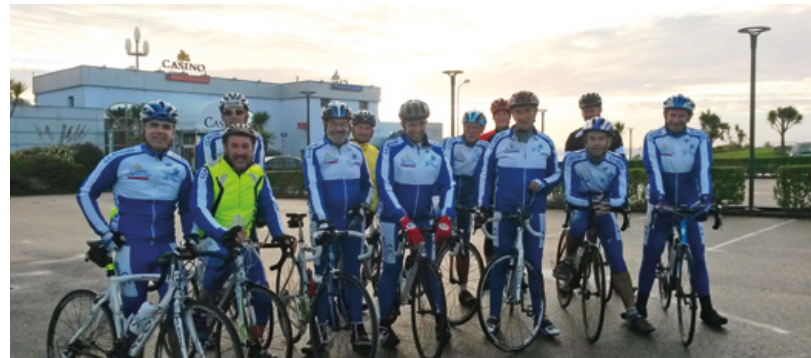
Le cyclo club de Roscoff propose des circuits pour les débutants et confirmés.

Le club propose également aux touristes ou aux autres cyclistes des balades découverte.