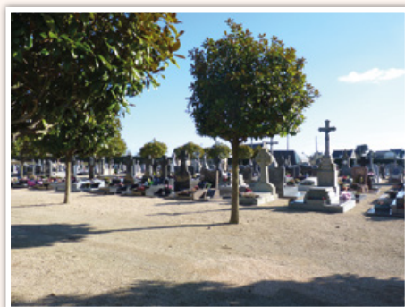
La construction d'un bâtiment de recueillement au cimetière.