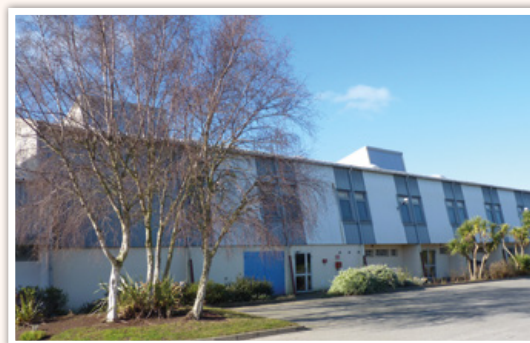
Les travaux d'amélioration sur la salle polyvalente.