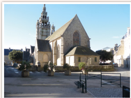
Les travaux de voirie autour de l'église.

Ainsi, au budget ont été ouverts, en section d'investissement, des crédits pour financer, principalement :