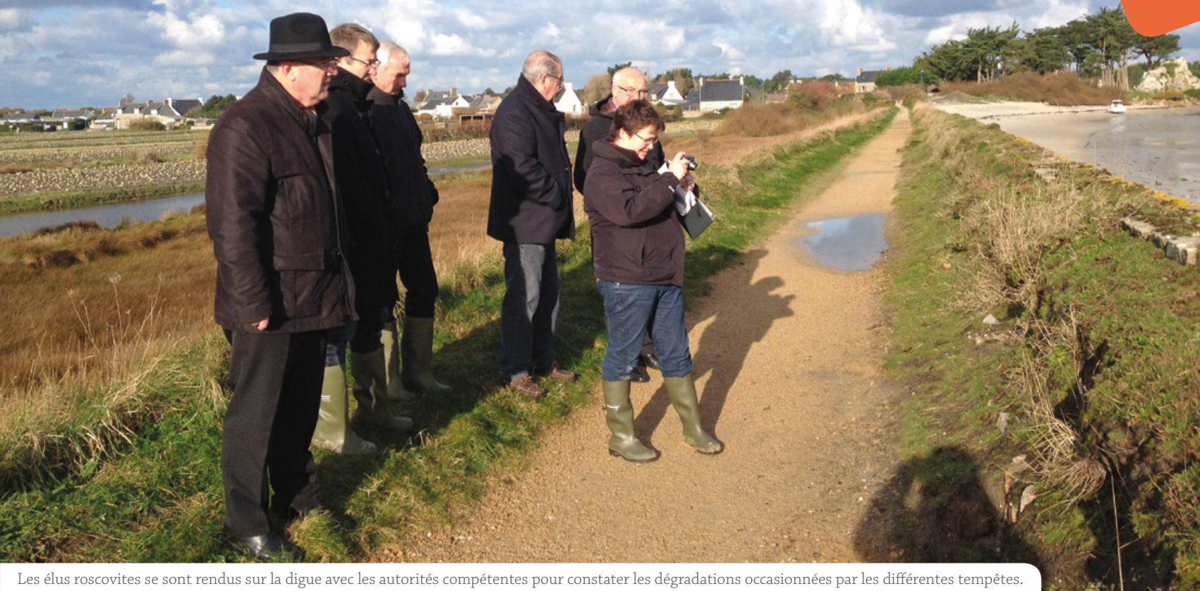
Les élus roscovites se sont rendus sur la digue avec les autorités compétentes pour constater les dégradations occasionnées par les différentes tempêtes.

Les tempêtes successives de ces dernières années ont occasionnées des dégradations importantes au niveau de la digue du Laber. La commune a alerté les autorités compétentes pour obtenir un diagnostic complet.