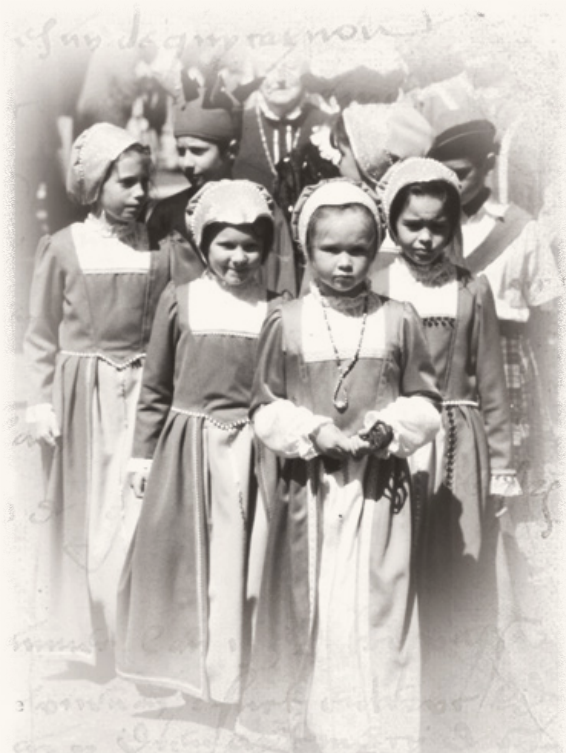
Commémoration du 450 ème anniversaire du débarquement de Marie Stuart à Roscoff – Gouel Rosko juin 1998

*Érigée vers 1510, elle se situait entre les maisons des 19 et 25 rue Réveillère. Laisée à l'abandon, elle fut rasée fin 1932 pour permettre l'accès au port.