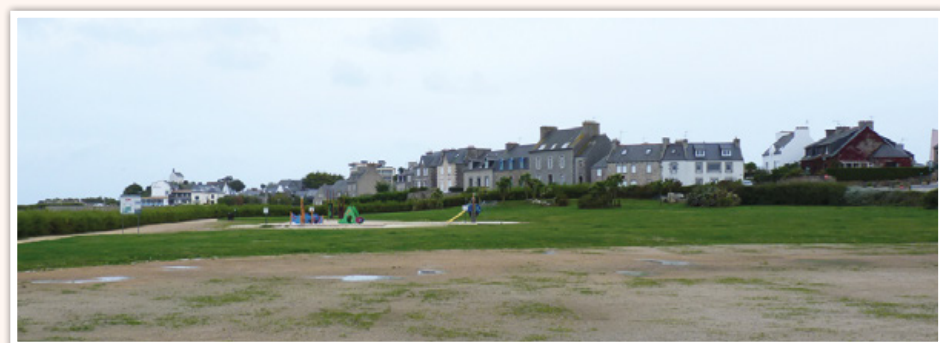
La maîtrise d'œuvre du futur centre nautique.