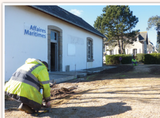
Les travaux d'aménagement de « l'Abri du Canot de Sauvetage », pour en faire un lieu d'exposition.