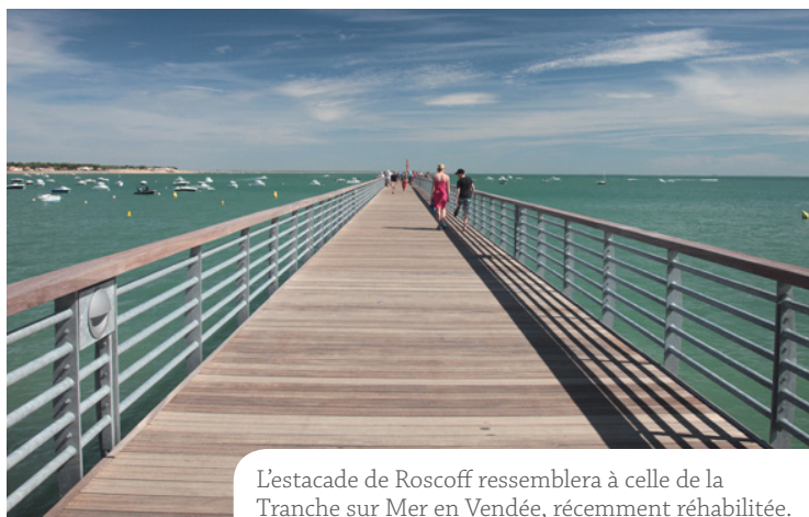
L'estacade de Roscoff ressemblera à celle de la Tranche sur Mer en Vendée, récemment réhabilitée.

Le budget devrait s'élever à 1 M€ environ, mais n'est pas encore complètement arrêté. Les travaux devraient débuter au premier semestre 2016. »