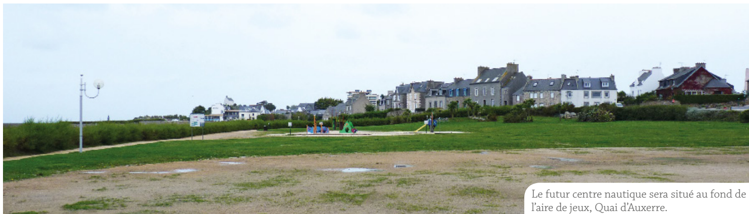
Le futur centre nautique sera situé au fond de l'aire de jeux, Quai d'Auxerre.