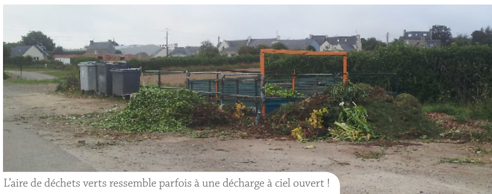
L'aire de déchets verts ressemble parfois à une décharge à ciel ouvert !