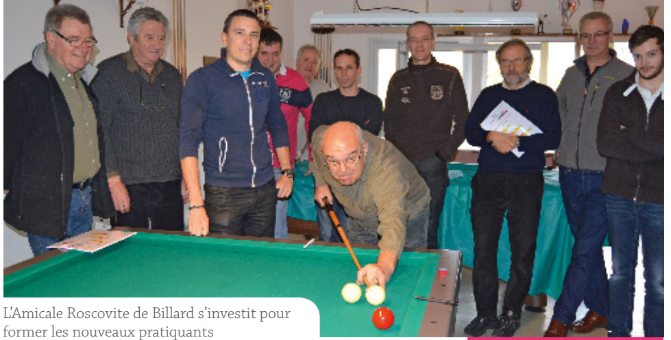
L'Amicale Roscovite de Billard s'investit pour former les nouveaux pratiquants

Facebook : Ville Roscoff / Twitter : @VilleRoscoff