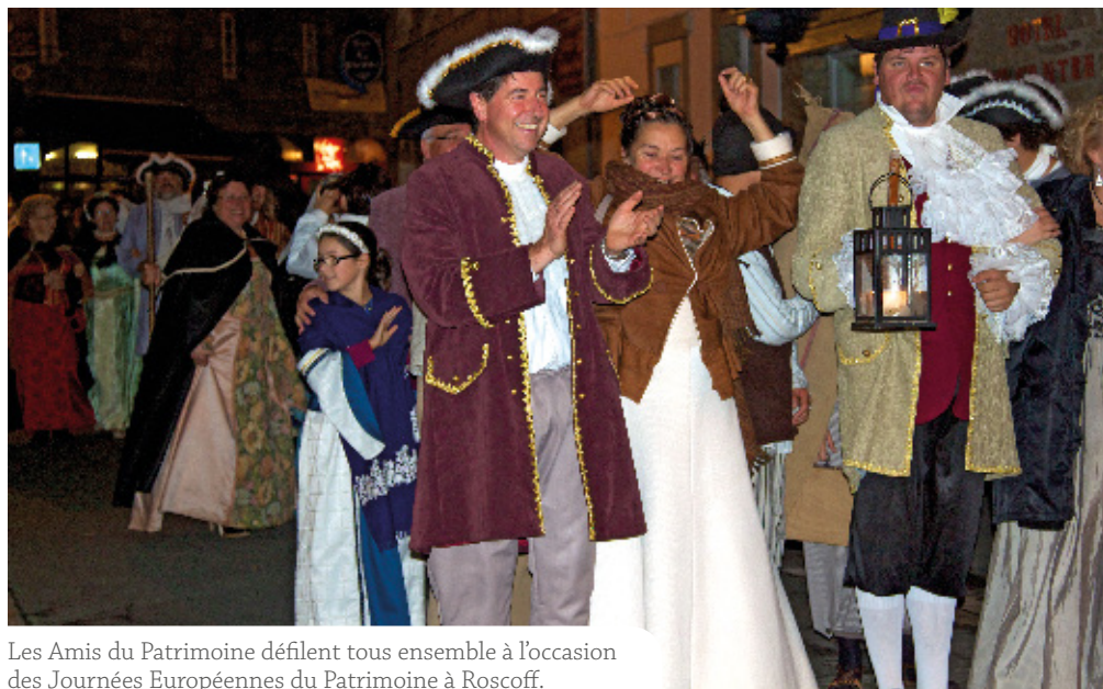
Les Amis du Patrimoine défilent tous ensemble à l'occasion des Journées Européennes du Patrimoine à Roscoff.

Les amis du Patrimoine, c'est l'histoire d'une bande de passionnés, tous amoureux de Roscoff. C'est notamment à travers les Journées du Patrimoine que ces bénévoles mettent à profit leurs talents divers et variés pour valoriser notre cité corsaire.