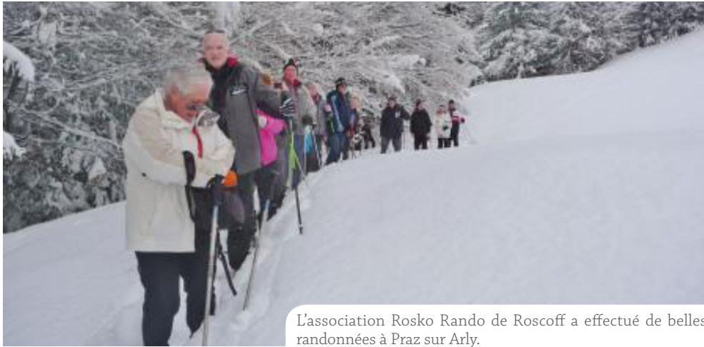
L'association Rosko Rando de Roscoff a effectué de belles randonnées à Praz sur Arly.

La ville de Roscoff est jumelée à Praz sur Arly depuis 2010. A l'occasion des Journées du Patrimoine, la chorale de Praz sur Arly passe quelques jours à Roscoff.