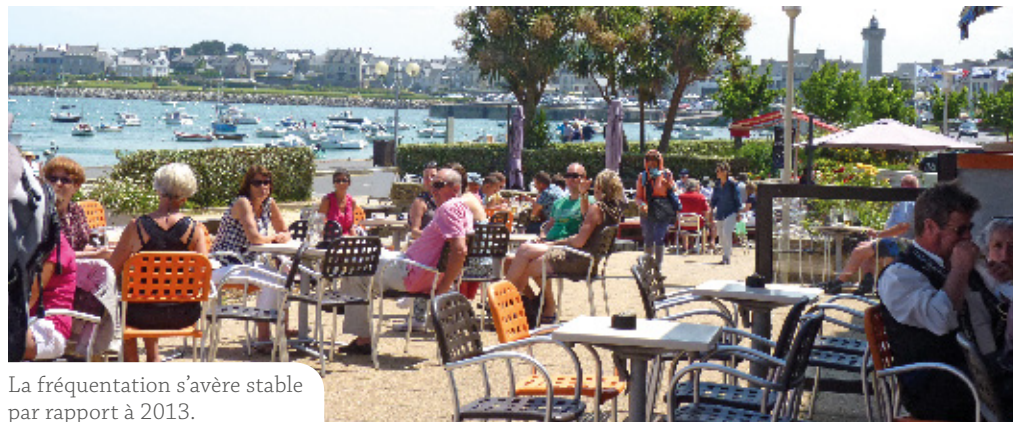
La fréquentation s'avère stable par rapport à 2013.

La saison à Roscoff n'est pas encore terminée mais l'Office du Tourisme de Roscoff a pu dresser un premier bilan de cette année 2014.