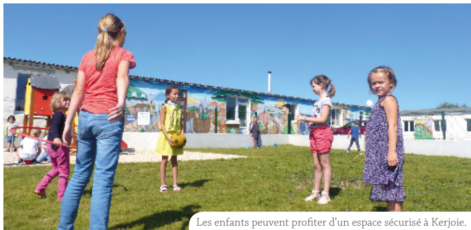
Les enfants peuvent profiter d'un espace sécurisé à Kerjoie.

Durant l'été, la cour du Centre de loisirs Kerjoie a été réaménagée.